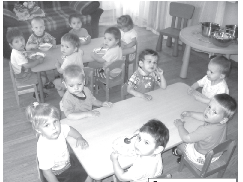
Дети ждут и надеются

Дом ребенка «Солнышко» был образован в 1946 году для детей, оставшихся без крова во время Великой Отечественной войны. Располагался он в одноэтажном здании, рассчитанном на 30 малышей. Отдельными зданиями стояла прачечная и кухня. Сотрудникам приходилось носить в ведрах по улице горячую воду и еду. Мыли детей водой из титана, для разогрева которого в ночную смену воспитатели и медсестры готовили дрова. С 1988 года Дом ребенка располагается в новом здании, отвечающем современным требованиям.