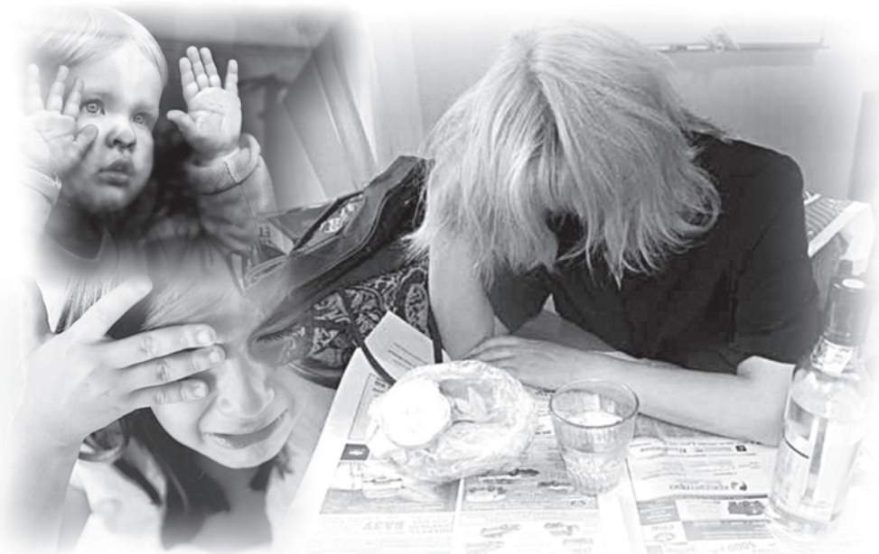
За последние два с половиной года в Ярцевском районе 91 человек был лишен родительских прав в отношении 89 детей. А восстановлены в правах всего трое родителей.