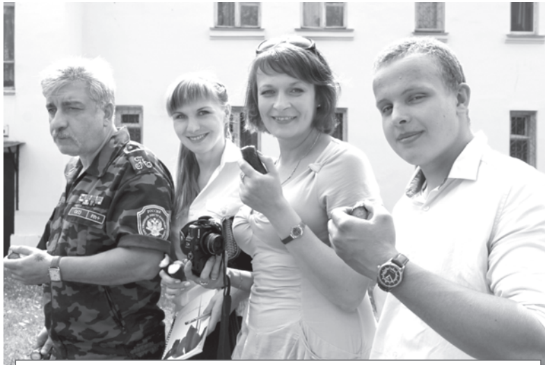
Представители Капыревщинского казачества дегустируют огурцы, выращенные в теплице Центра «Радуга»

А работы, требующей приложения крепкой мужской силы, в «Радуге» накопилось немало.